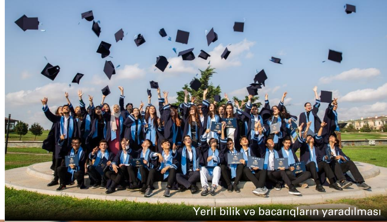
Yerli bilik və bacarıqların yaradılması