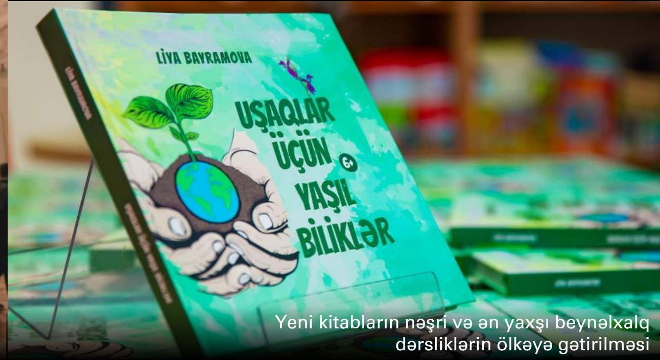
Yeni kitabların nəşri və ən yaxşı beynəlxalq dərslərin ölkəyə gətirilməsi