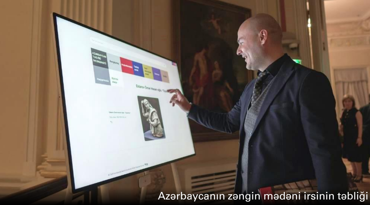
Azərbaycanın zəngin mədəni irsinin təbliği