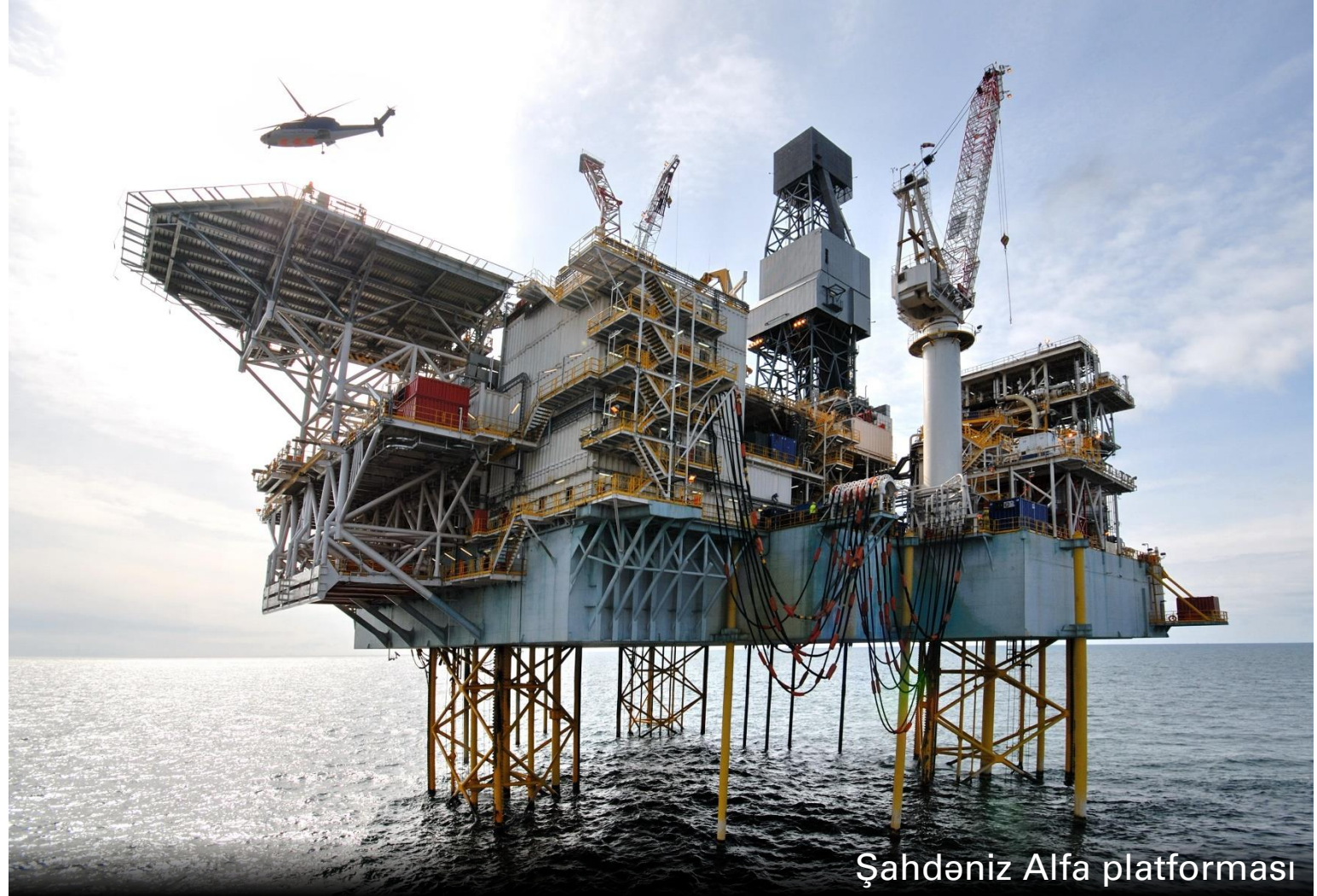
Şahdəniz Alfa platforması