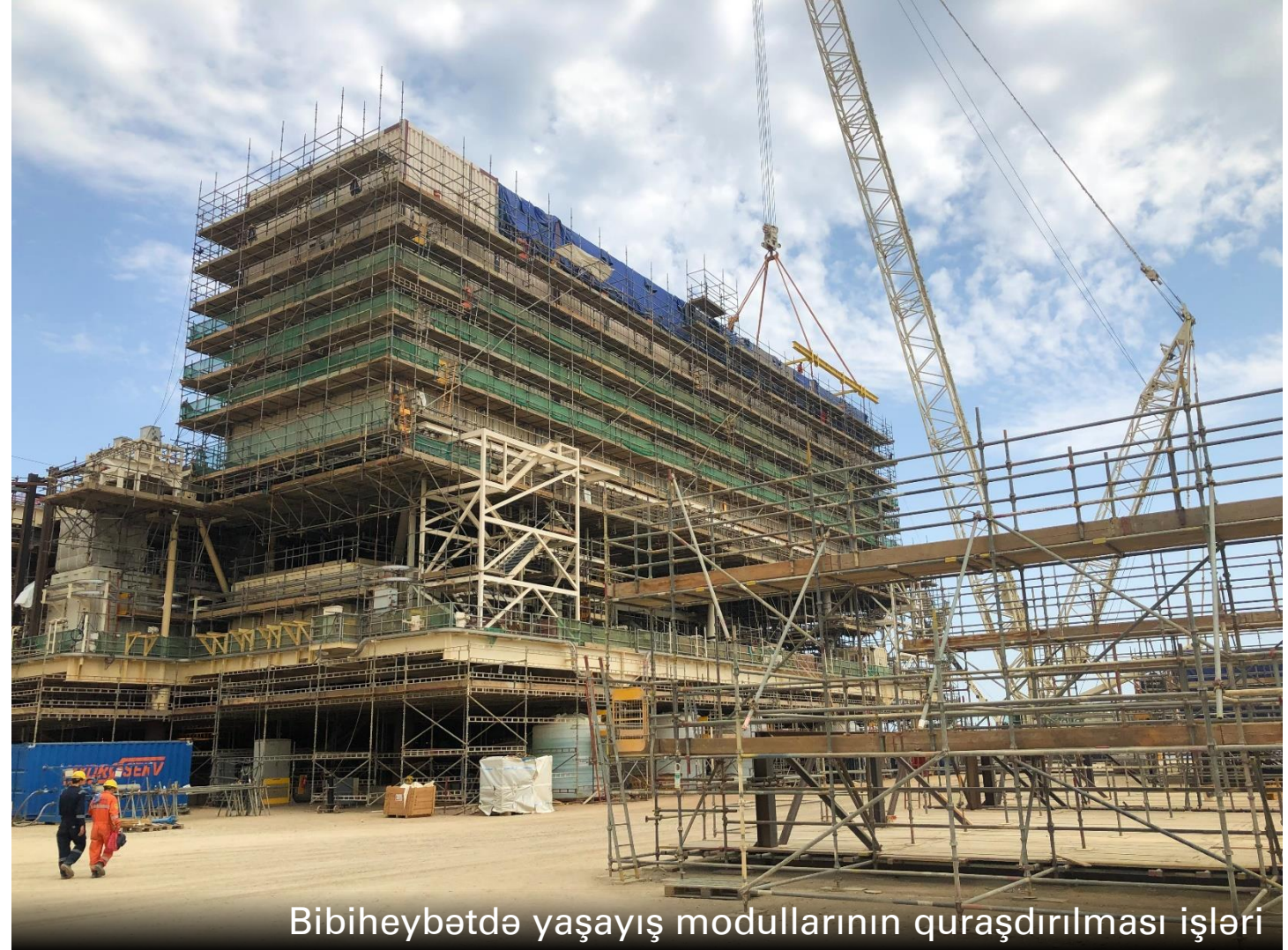
Bibiheybətdə yaşayış modullarının quraşdırılması işləri