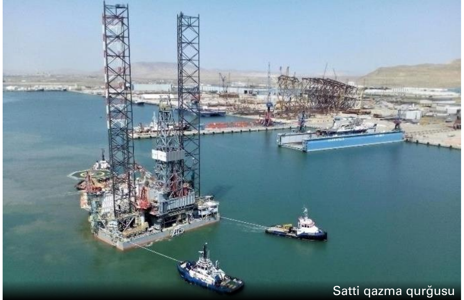
Satti qazma qurğusu