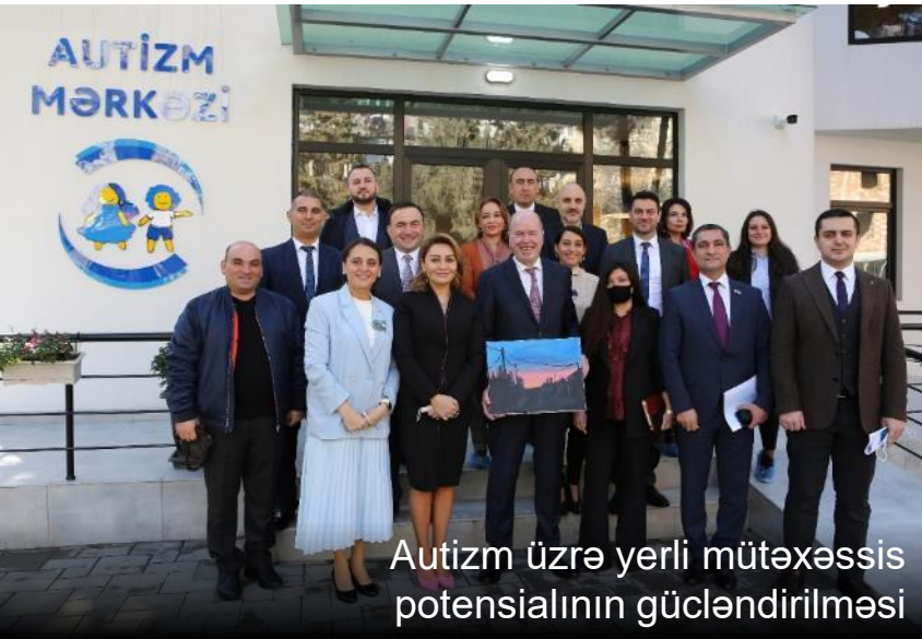
Autizm üzrə yerli mütəxəssis potensialının gücləndirilməsi