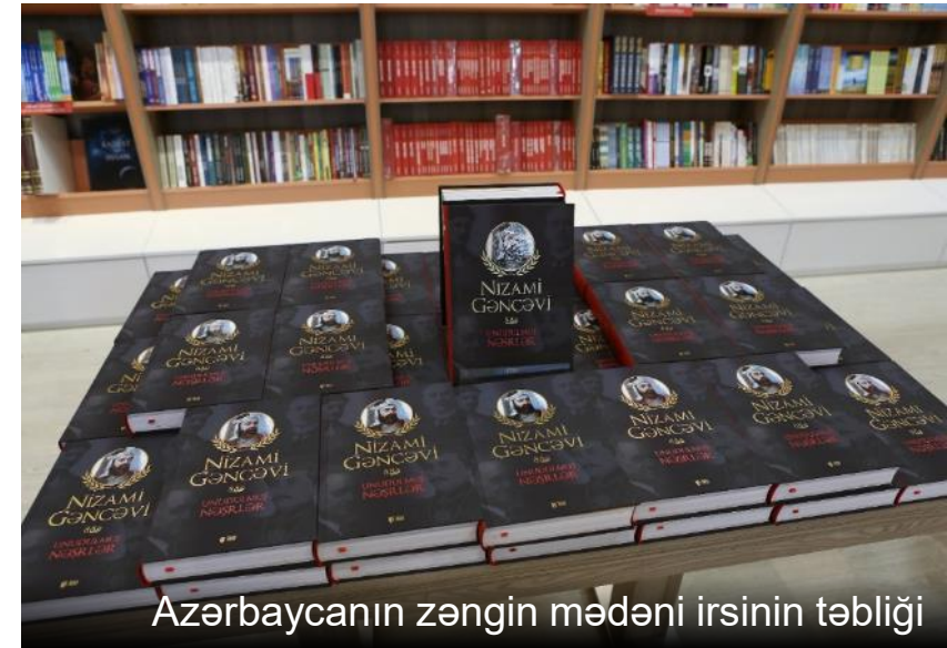
Azərbaycanın zəngin mədəni irsinin təbliği