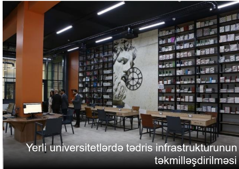
Yerli universitetlərdə tədris infrastrukturunun təkmilləşdirilməsi