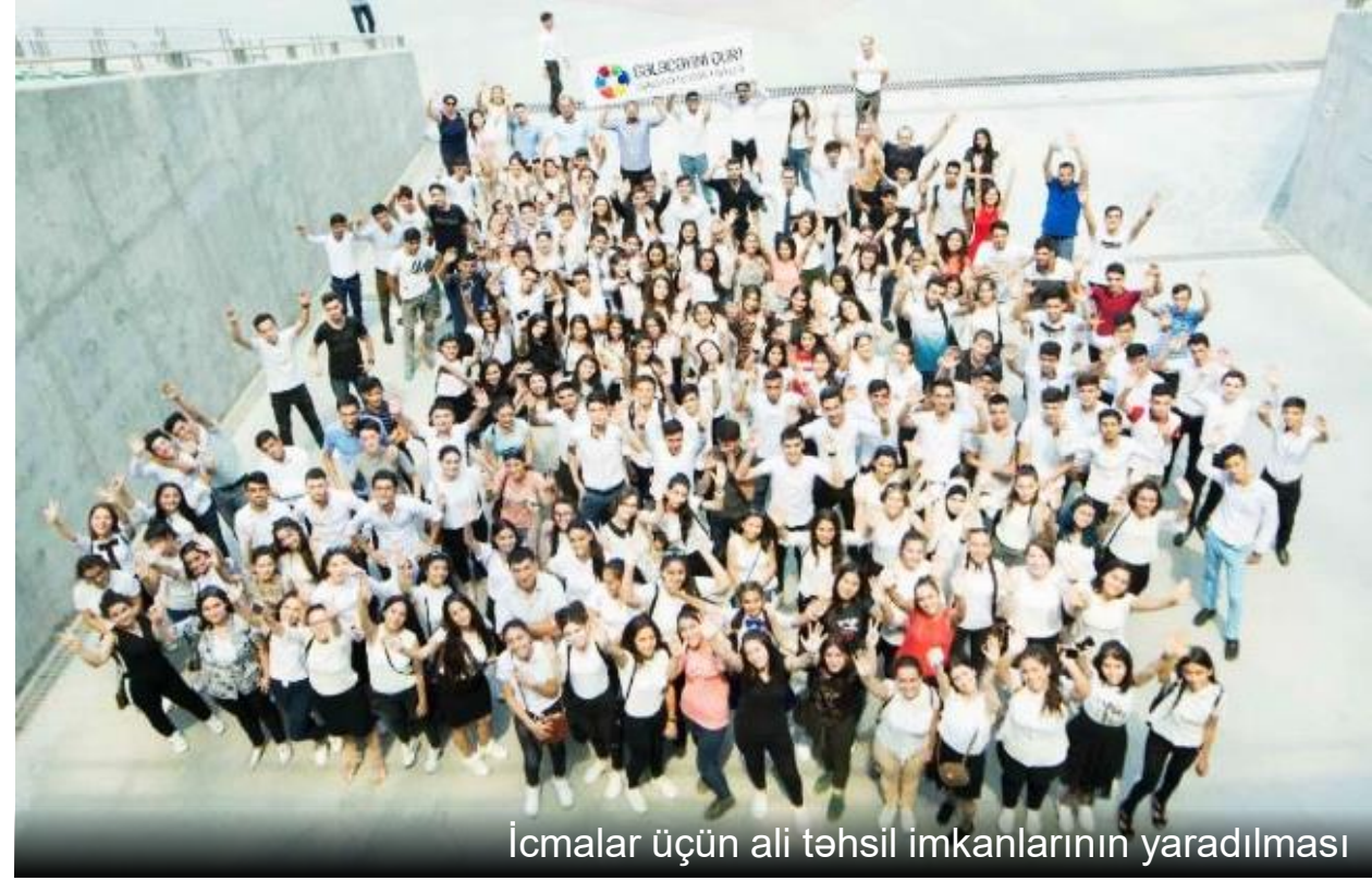
İcmalar üçün ali təhsil imkanlarının yaradılması