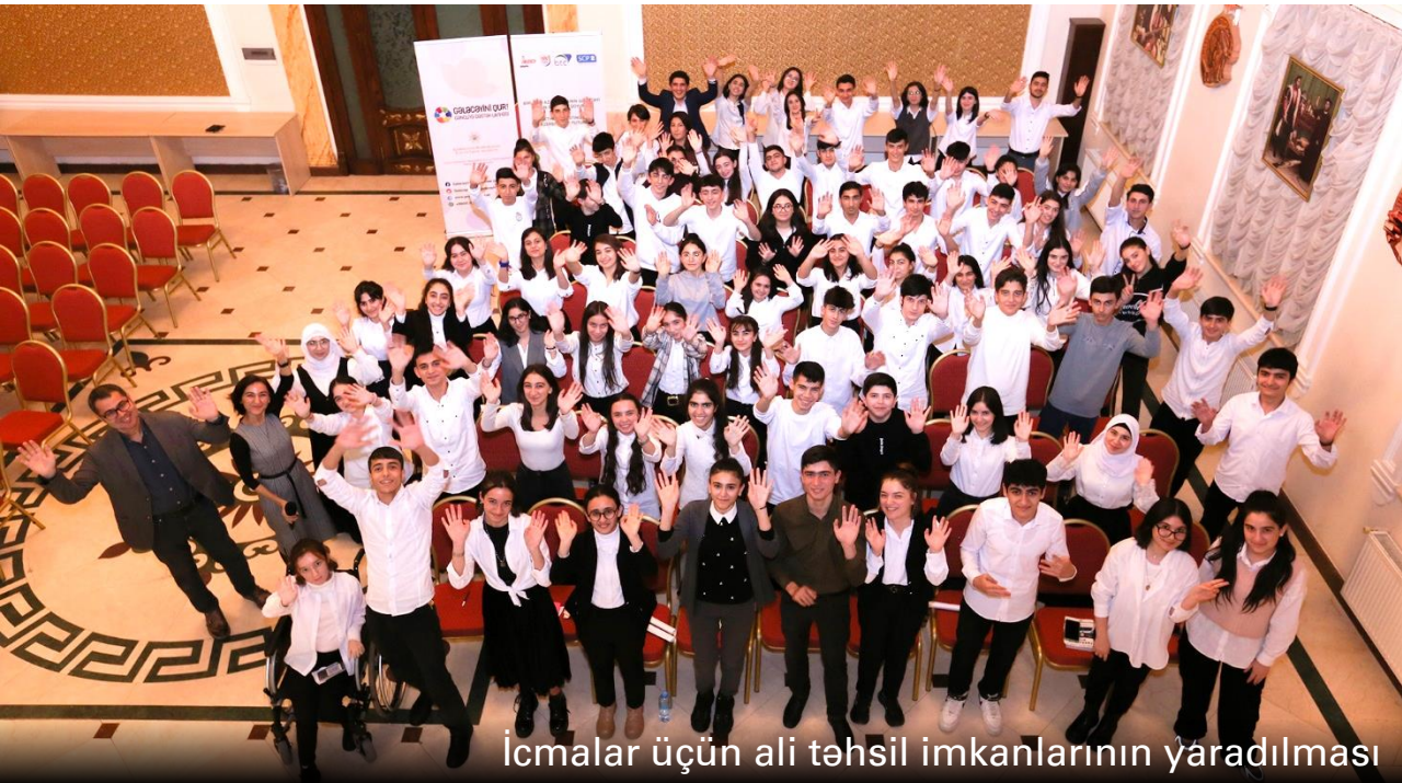
İcmalar üçün ali təhsil imkanlarının yaradılması