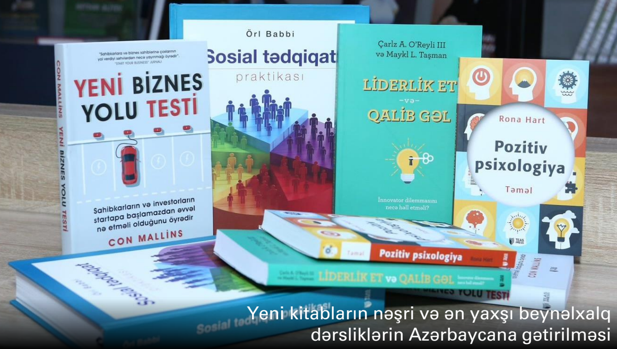
Yeni kitabların nəşri və ən yaxşı beynəlxalq dərsliklərin Azərbaycana gətirilməsi