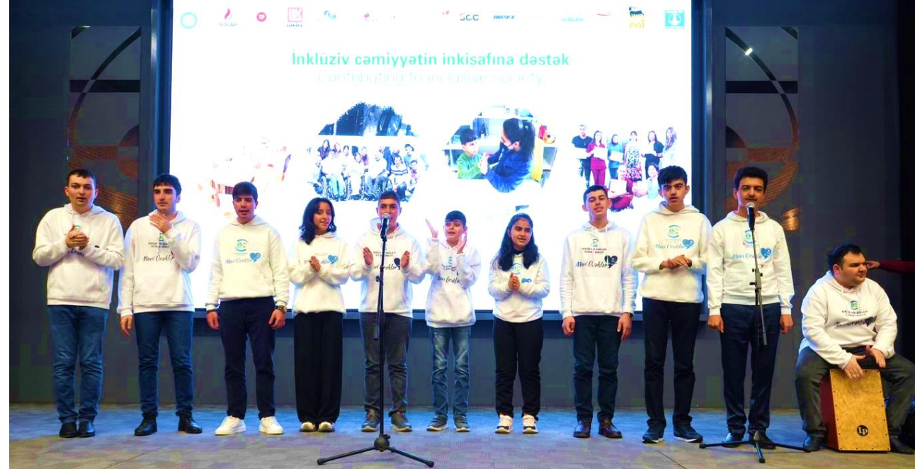
Azərbaycanda əlilliyi olan şəxslərin cəmiyyətə inteqrasiyasına dəstək