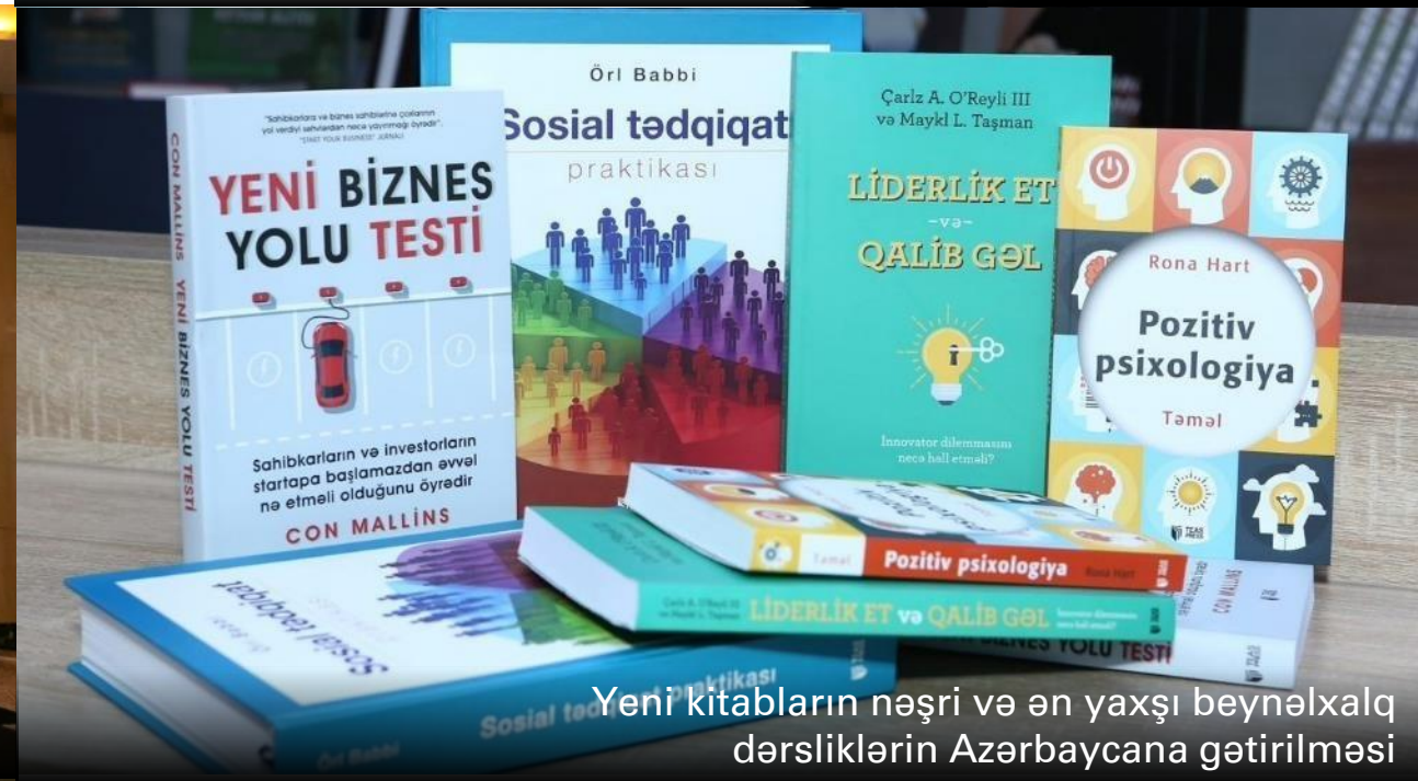
Yeni kitabların nəşri və ən yaxşı beynəlxalq dərsliklərin Azərbaycana gətirilməsi