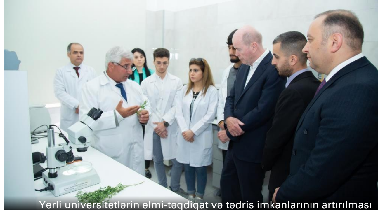
Yerli universitetlərin elmi-tədqiqat və tədris imkanlarının artırılması