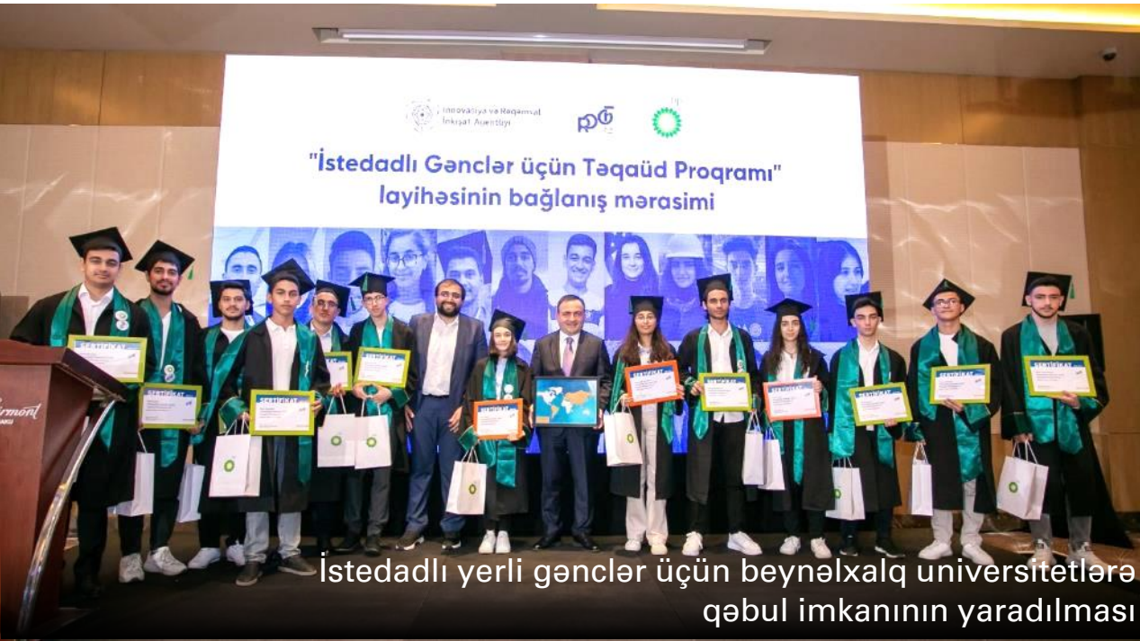
İstedadlı yerli gənclər üçün beynəlxalq universitetlərə qəbul imkanının yaradılması