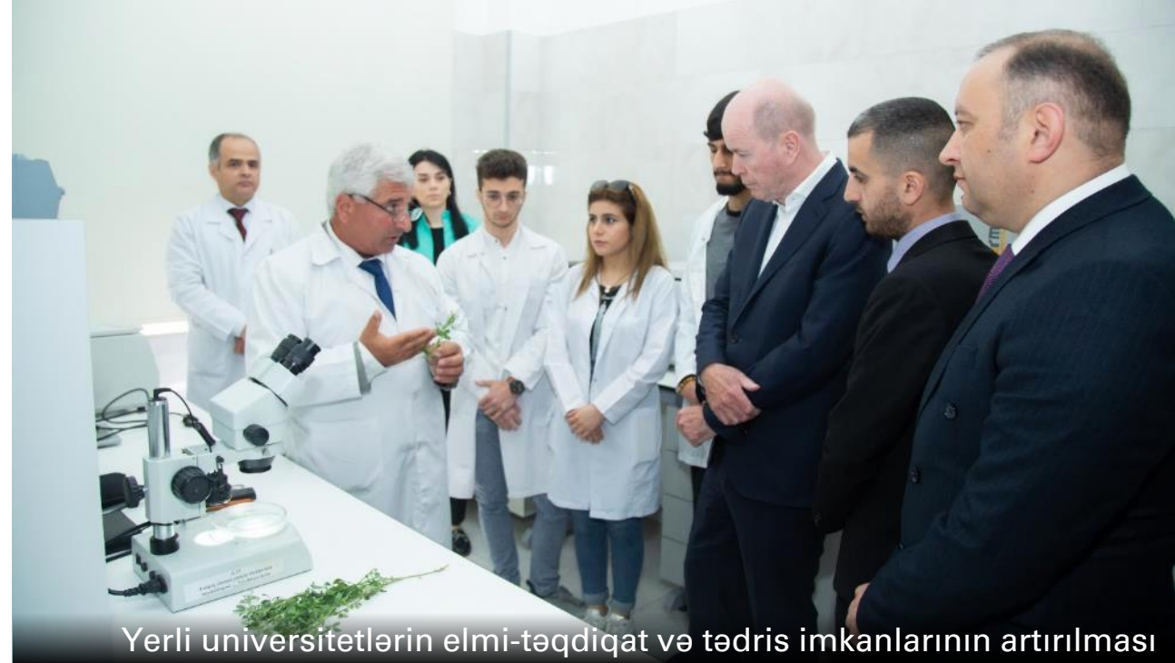
Yerli universitetlərin elmi-tədqiqat və tədris imkanlarının artırılması