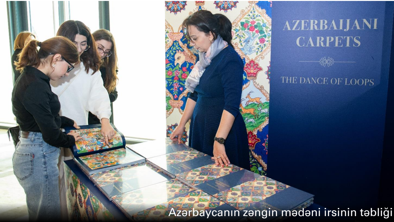
Azərbaycanın zəngin mədəni irsinin təbliği