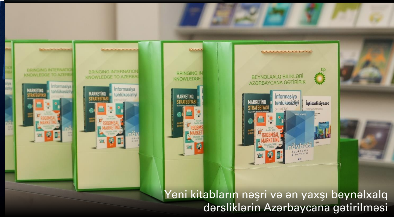
Yeni kitabların nəşri və ən yaxşı beynəlxalq dərsliklərin Azərbaycana gətirilməsi