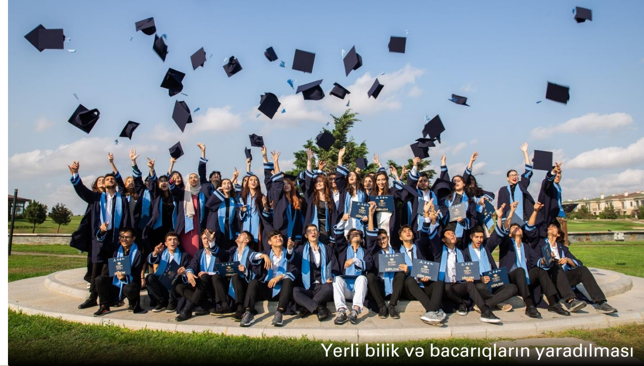
Yerli bilik və bacarıqların yaradılması