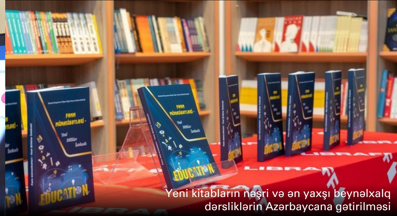
Yeni kitabların nəşri və ən yaxşı beynəlxalq dərsliklərin Azərbaycana gətirilməsi