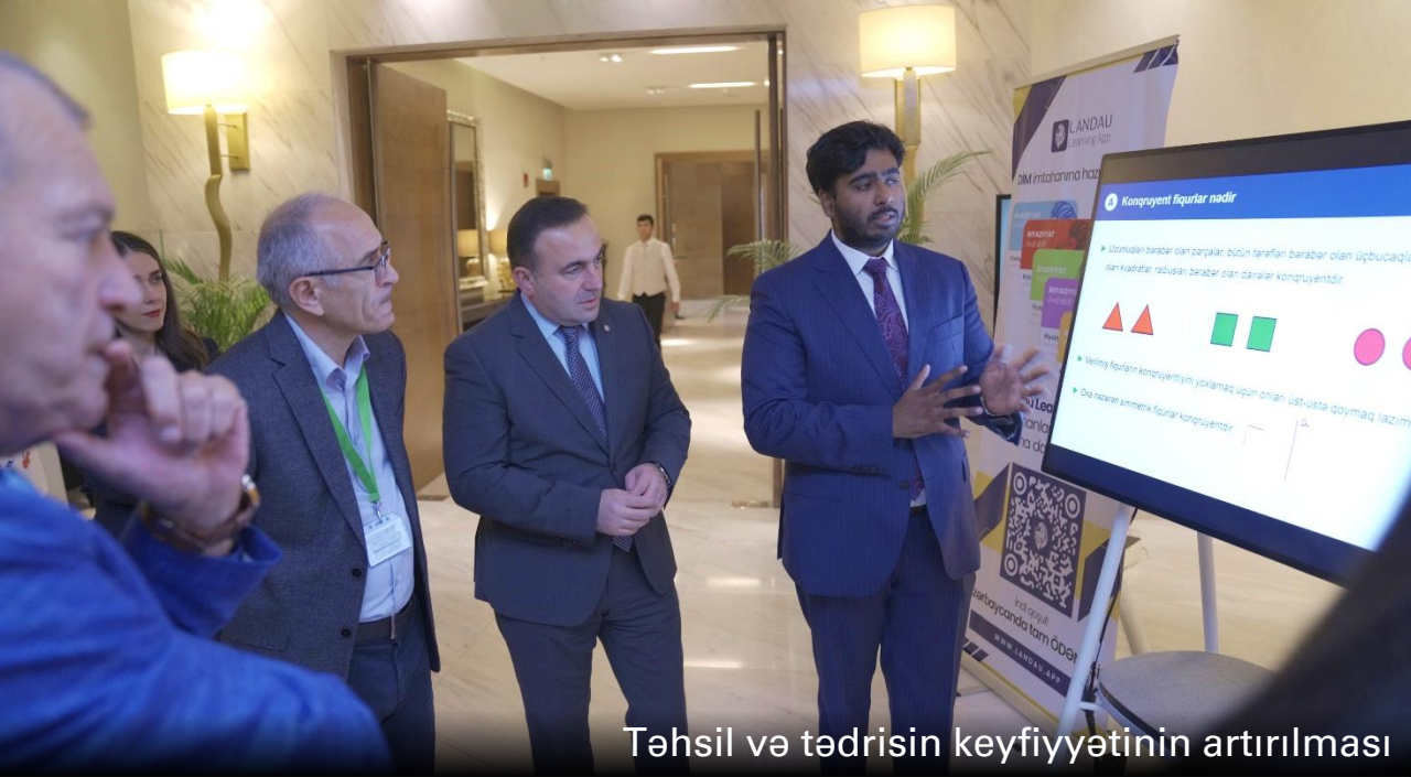
Təhsil və tədrisin keyfiyyətinin artırılması