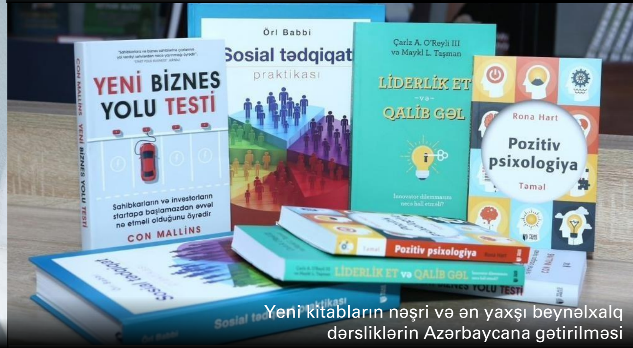
Yeni kitabların nəşri və ən yaxşı beynəlxalq dərsliklərin Azərbaycana gətirilməsi