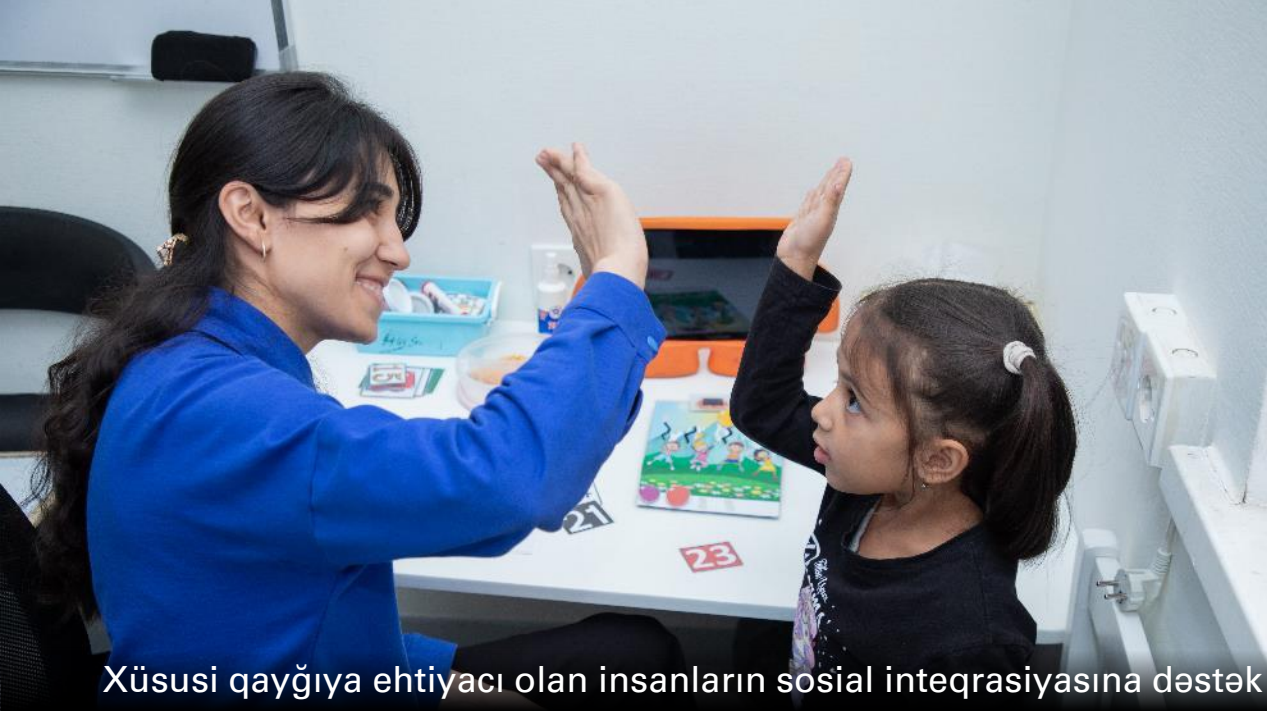
Xüsusi qayğıya ehtiyacı olan insanların sosial inteqrasiyasına dəstək