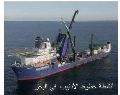
أنشطة خطوط الأنابيب في البحر

أكملت المنصة العائمة للإنتاج والتخزين والتفريغ أشغال الصيانة في سنغافورة، حيث احتاج الفريق إلى إنهاء بعض التثبيتات الإضافية. وهي الآن تواصل رحلتها لترسو في السواحل المقررة لها حيث كانت الفرق تحضر لوصولها. ستبحر السفينة مسافة قدرها 12000 ميل بحري قبل أن ترسو في الموقع الذي سيبدأ فيه التشغيل.