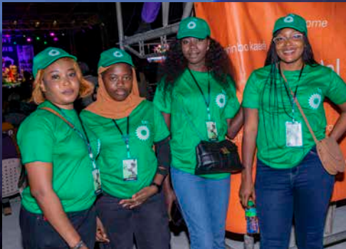
رعاية bp لمهرجان الجاز

للعام الثاني على التوالي، قامت شركة bp برعاية مهرجان الجاز الدولي في سان لويس، والذي أقيم في الفترة من 25 إلى 29 مايو 2023. وهذا الحدث الثقافي المهم هو احتفال بالفن والثقافة اللذين يؤدبان دوراً أساسياً في التنمية الاجتماعية لمنطقة سانت لويس. وقد أتاح المهرجان الفرصة لكل من المشاهير العالميين والفنانين السنغاليين الشباب للتعرف على جماهير جديدة والتواصل بين الفنانين ذوي اهتمامات مشتركة.