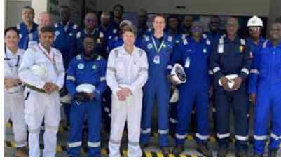
وفد حكومة السنغال برئاسة مدير المحروقات، باب سامبا با

الزيارة جولة في المرافق وعرض عن مستجدات المشروع، وقد لقي استحسان الضيوف المدعوين. كما استقبل الزوار ممثلين عن شركة bp و Golar و Keppel على متن سفينة الغاز الطبيعي المسال حيث أشغال البناء مازالت جارية. أتيحت للوفد فرصة زيارة السفينة، والتعرف على مكونات المشروع، وتلقوا عرضا وافيا عنه.