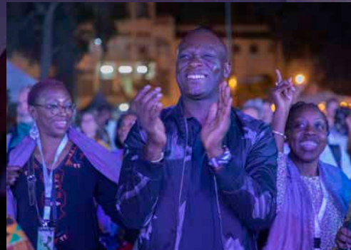
مسابير سيسي في مهرجان سان لويس للجاز