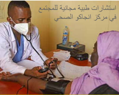
استشارات طبية مجانية للمجتمع في مركز انجاكو الصحي

استثمرت bp وشركاؤها، كوسموس والشركة الموريتانية للمحروقات، في برامج الاستثمار الاجتماعي التي تهدف إلى تحسين الظروف المعيشية في المجتمعات التي نعمل فيها. وتعتبر الصحة أحد مجالات التركيز الرئيسية.