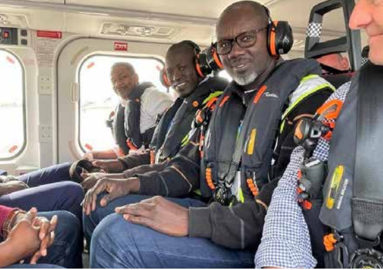
مسؤولو الوكالة الوطنية للطيران المدني بالسنغال يسافرون في رحلة أولى إلى المحطة المركزية

شهد شهر أبريل من سنة 2023 حدثًا مهمًا وهو هبوط أول رحلة لطائرة هليكوبتر على منصة مرافق الخدمات والوحدات السكنية، الواقعة في المياه السنغالية في المحطة المركزية لمشروع تورتو أحميم الكبير.