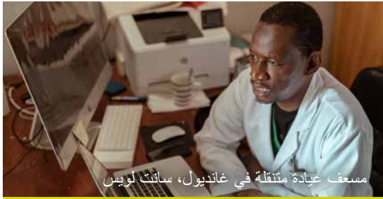
مسعف عيادة متنقلة في غانديول، سانت لوي

من أجل دعم الولوج إلى الرعاية الصحية لسكان سانت لوي، تم إطلاق أنشطة عيادة متنقلة في أكتوبر 2020. وتزامن تنفيذ البرنامج مع انتشار جائحة COVID-19، وتزامن بالتالي مع القيود المفروضة على السكان. ولذلك كرست الأنشطة الأولى لتعزيز الإستراتيجيات لتطعيم الأطفال في المناطق النائية من غانديول والتوعية بالوقاية من الأمراض.