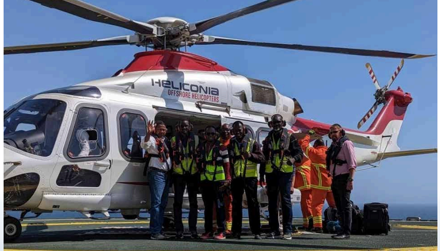
أول استقبال لطائرة هليكوبتر على منصة مرافق الخدمات والوحدات السكنية في المحطة المركزية

ستتكرر هذه العملية مع موريتانيا عن طريق الوكالة الوطنية للطيران المدني، عندما تصل المنصة العائمة للإنتاج والتخزين والتفريغ إلى المياه الموريتانية في وقت لاحق من عام 2023.