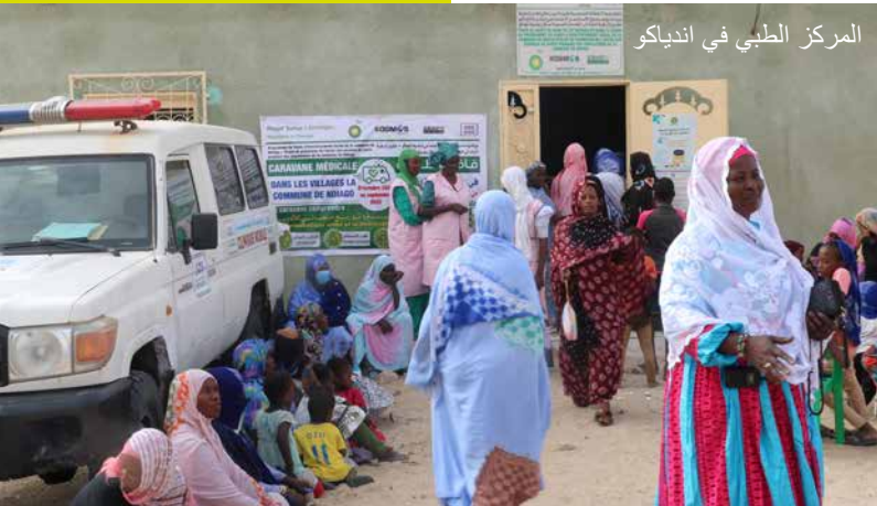
المركز الطبي في اندياكو

” لقد ساهم المشروع الصحي في انجاكو بشكل كبير في رفاهية المجتمع “ دودو كي، شيخ قرية اندياكو