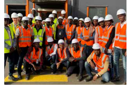
مجموعة من طلاب المعهد الوطني للنفط والغاز

في تطوير قطاع الطاقة في السنغال، وتدعمه شركة bp منذ عام 2018؛ في العام الماضي 2022، وقعت شركة bp مذكرة تفاهم لمواصلة دعمها للمعهد لأربع سنوات إضافية. وقد سبق أن قدمت الشركة منحة دراسية