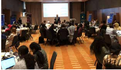
ورشات حقوق العمال في السنغال

شهد اليوم الأول جلسة أوعشها متخصصون وخبراء في مجال الموارد البشرية وقادة في مجال حقوق العمال. أتيحت الفرصة للحضور لاكتساب رؤى جديدة حول توقعات