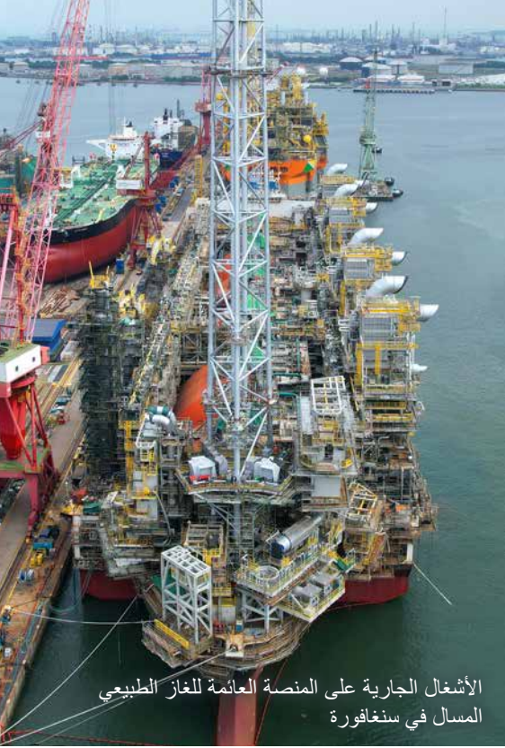
الأشغال الجارية على المنصة العائمة للغاز الطبيعي المسال في سنغافورة