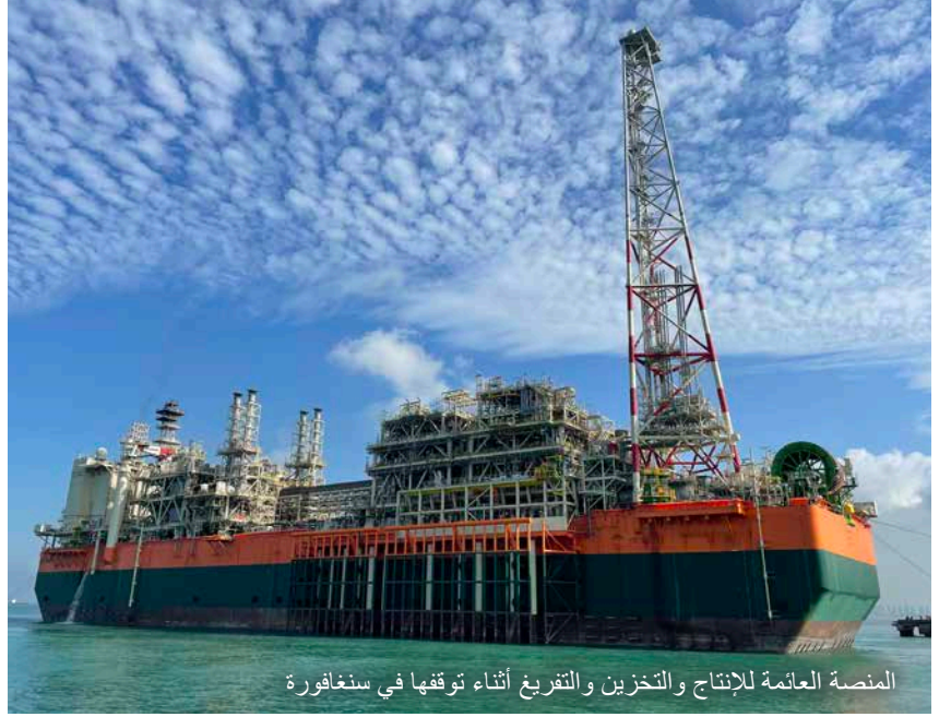
المنصة العائمة للإنتاج والتخزين والتفريغ أثناء توقفها في سنغافورة