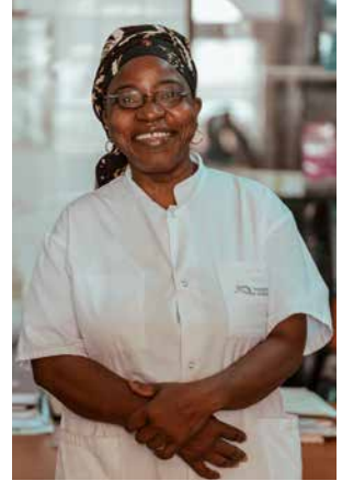
مستشار طبي في غانديول

وقد عززت مقاربة العيادة المتنقلة إمكانية حصول الفئات الضعيفة من السكان على الرعاية، وخاصة في المناطق التي يصعب الوصول إليها، حيث تمكن عدد من السكان من استشارة طبيب أو أخصائي لأول مرة.