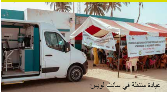
عيادة متنقلة في سانت لوي

وتعد هذه الطريقة مكملا للنظام الصحي، حيث تخلق صلة بين المجتمع ومقدمي الرعاية الصحية لتسهيل الرفع والمداومة في المرافق الصحية.