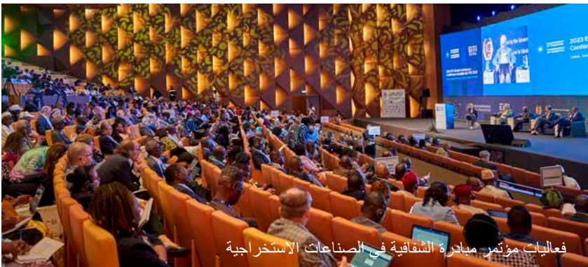
فعاليات مؤتمر مبادرة الشفافية في الصناعات الاستخراجية

وكان من بين الضيوف الكرام معالي السيد أمادو با، الوزير الأول السنغالي، الذي ألقى الكلمة الافتتاحية، ومعالي الوزير الأول الموريتاني، محمد بلال مسعود الذي نال جائزة