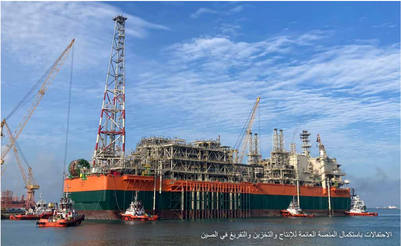
الاحتفالات باستكمال المنصة العائمة للإنتاج والتخزين والتفريغ في الصين

وصل المشروع إلى مرحلة مهمة جدا بتاريخ 20 يناير 2023، حيث انطلقت المنصة العائمة للإنتاج والتخزين والتفريغ من حوض بناء السفن في كيدونغ بالصين، مبحرة نحو موقع المشروع، بعد الانتهاء بنجاح من سلسلة من التجارب البحرية.