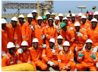
طلاب من المعهد في المحطة المركزية لمشروع تورتو آحميم الكبير

كما قام مدربي المعهد برحلة ثانية إلى موريتانيا لتقديم دورة تكوينية جديدة لموظفين من وحدة الضرائب والجمارك المشتركة بين السنغال وموريتانيا. وكان الموضوع «تطوير الحقول البحرية - تورتو آحميم الكبير نموذجاً». وكان الهدف من الدورة هو إلقاء نظرة فاحصة على تطوير مشاريع الاستكشاف والإنتاج، والمشاكل المطروحة ومشاركة الشركات المتعاقدة في مختلف المكونات الرئيسية والفرعية، وخاصة في ما يتعلق بمشروع تورتو آحميم الكبير