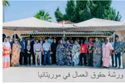
ورشات حقوق العمال في موريتانيا

بينهم وتبادل وجهات نظرهم وأفكارهم. وقد تمكن الحاضرون من فهم حقوق العمال وتعلموا إستراتيجيات سيقومون بتنفيذها في شركاتهم للوفاء بالتزاماتهم القانونية والاجتماعية والتعاقدية.