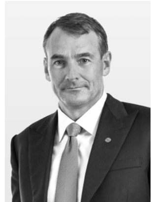
Bernard Looney Chief Executive Officer